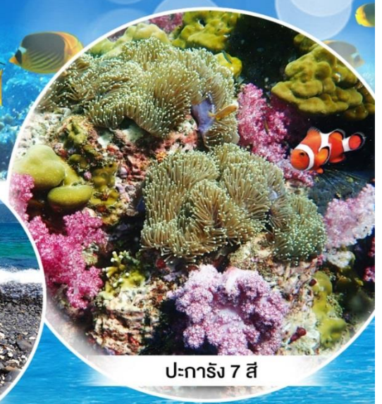
ปะการัง 7 สี