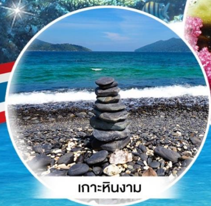
เกาะหินงาม