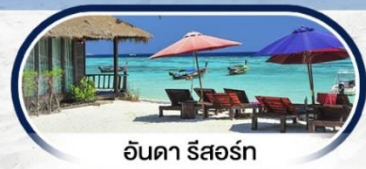
อันดา รีสอร์ท

บินตรง NOK AIR ** บินเช้า-ออก หาดใหญ่ **